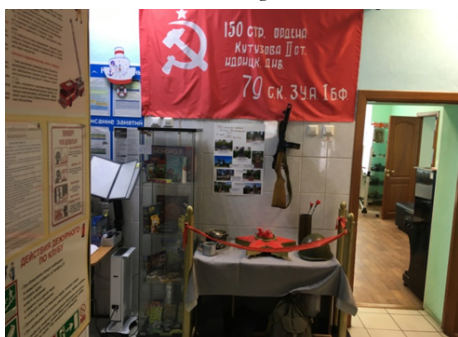
Фото 3. Тематическое оформление пространства холла ко Дню Победы