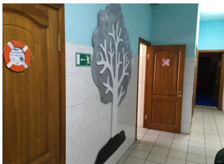
Фото 5. Стенд в холле клуба: основа