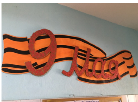
Фото 4. Тематическое оформление пространства холла ко Дню Победы