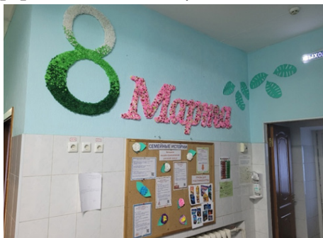
Фото 2. Тематическое оформление пространства стен к 8 Марта