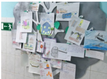
Фото 6. Стенд в холле клуба: ответы детей и родителей на задания адвент-марафона